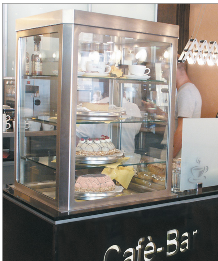
Einbau-Kühlvitrine für Kuchen, Torten und Snacks